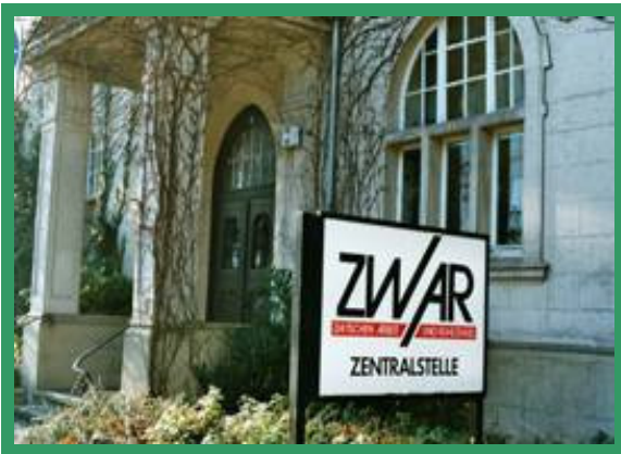
Das ZWAR-Haus in Dortmund-Marten